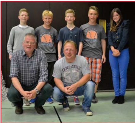
Schüler und Trainer bei der Judo Bundesliga.