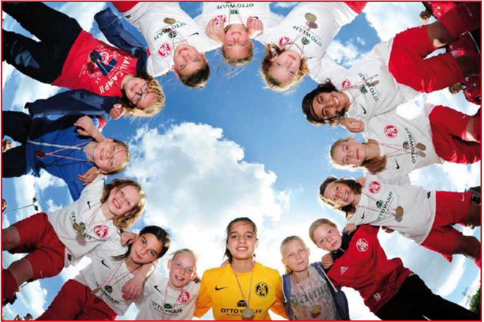
So sehen Sieger aus: Die D-Mädchen wurde Hamburger Pokalsieger!

auch Begegnungen und Smalltalks mit den Teams anderer Nationen dafür, dass die Mädels diese Ausfahrt nicht so schnell vergessen werden.