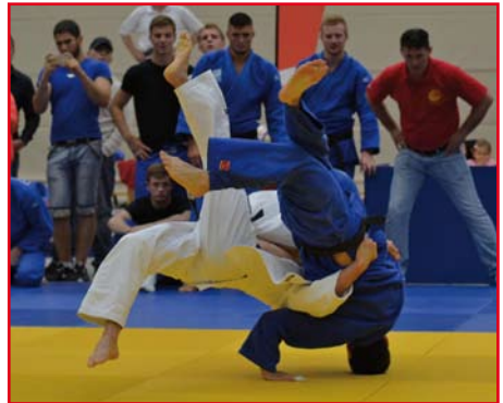
Punkt für Frankfurt, die Mannschaft mit den weißen Anzügen.