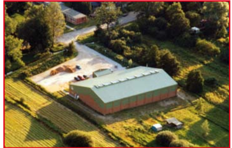
Die Halle in Fünfhausen 1998