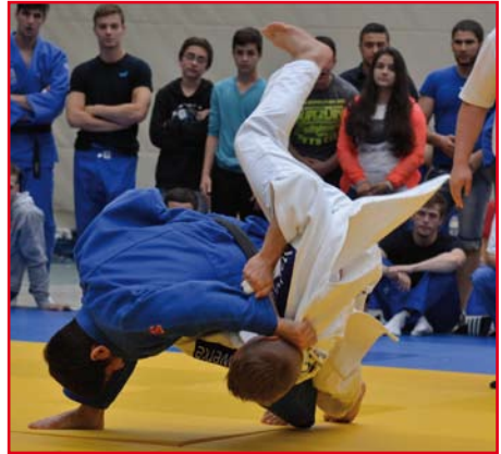
Die Schüler brachten interessante Judo-Fotos mit. Diese Judotechnik brachte einen Punkt für Hamburg, die Männer mit den blauen Judoanzügen

Beide Mannschaften kämpften jede Einzelbegegnung bis zum bitteren Ende mit gegenseitigem Respekt aus. 8:6 war das Endergebnis für das Hamburger Judo-Team.