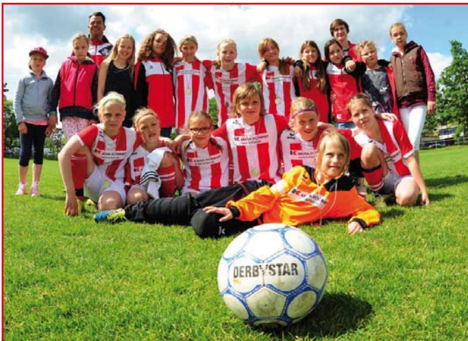
Unsere E-Mädchen spielten eine tolle Saison und wurden Vizepokalsieger

Mädchen viel Spaß gehabt und eine Menge wertvoller Erfahrungen gesammelt. Auch die sehr körperbetonte skandinavische Art Fußball zu spielen konnte unsere D-Mädchen nicht davon abhalten, den Gistrup-Cup mit nach Hause zu nehmen. Außerhalb des Platzes sorgten unter anderem Highlights wie ein Ausflug in den Freizeitpark „Sommerland“, eine Teendisco und ein Feuerwerk, aber