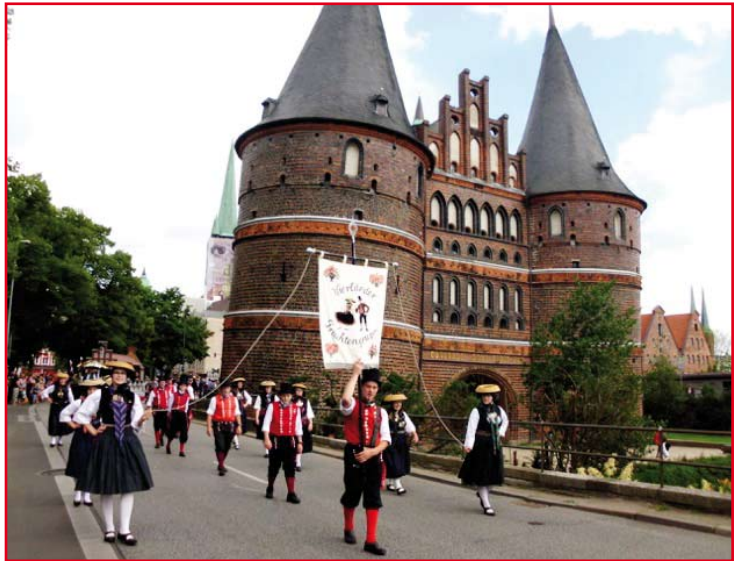
Vor dem Holstentor

Wer Interesse hat, an so schönen Veranstaltungen teilzunehmen und gerne die prächtige alte Vierländer Tracht prä-